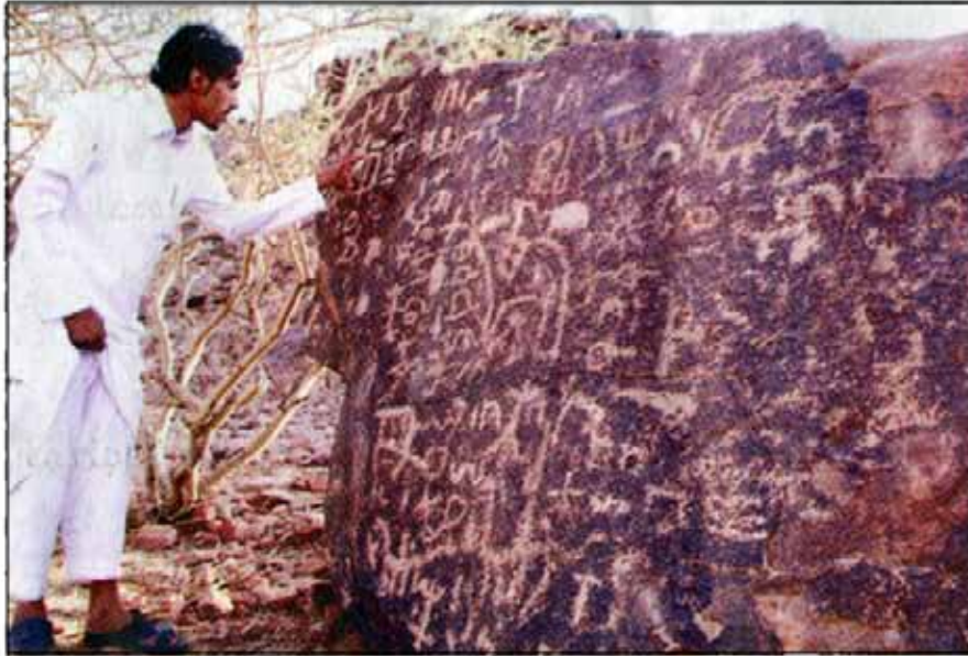
الكلبي يحاول فك الرموز

قام أحد الشباب في طيبة بفك النقوش الحجرية القديمة، والتي هي إحدى أدوات التعليم للأجيال السابقة، والتي من خلالها اتضح أنهم كانوا يتعلمون القراءة والكتابة على تلك الصخور، وتجد في صخرة واحدة قد نقشت وكتبت أحرف ثم أعادوا كتابتها مرة أخرى بطريقة أجمل من السابقة، والتي لا تخلو من بعض الشعارات والرسومات للحيوانات والأشجار المعروفة في تلك المناطق، ولعل المهتمين بهذه الآثار استطاعوا أن يحلوا رموز تلك الكتابات والشعارات، فلعن هذا الشاب الذي يقف أمام