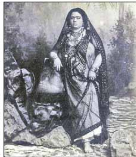
صور من «روح مصر»