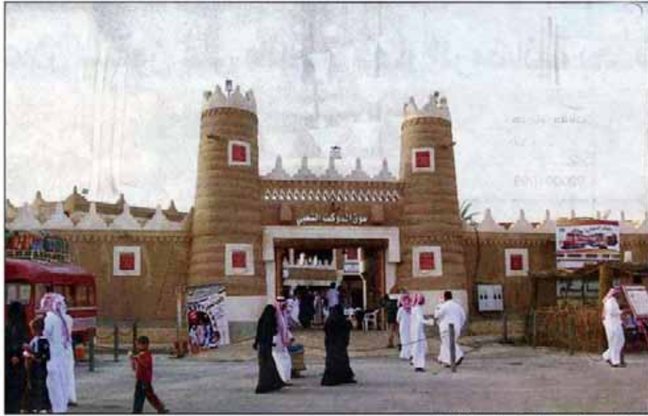
سوق المسوكف بعنيزة .. واجهة للتراث