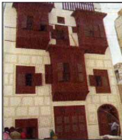
جانب من المجمع الاثري

وأعمال حقن الأساسات باستخدام مادة كيميائية قوية تفنذ في الفراغات بين الجدران لتدعيم تماسك المبنى. مؤكداً أنه تم الانتهاء من إعداد الدليل الفني للترميم وجاري طباعته حيث يتم توفيره مجاناً بثلاث لغات هي العربية والإنجليزية والفرنسية لجميع المهتمين من مهندسين وعلماء آثار ومشاركين وطلبة جامعات، ولهذا الدليل الآن صفحة على موقع الأمانة على الإنترنت، مضيفاً بأنه سيتم استخدام بعض الفراغات الخارجية في المجمع كقاعات إحداهما للاجتماعات تسع لحوالي ٢٠ شخصاً وسيتم تزويدها بأجهزة عرض مرئي، وأخرى سيتم استخدامها كقاعة مناسبات تستوعب نحو ٥٠ شخصاً وتزيد مساحتها على ٢٠٠ متر مربع.